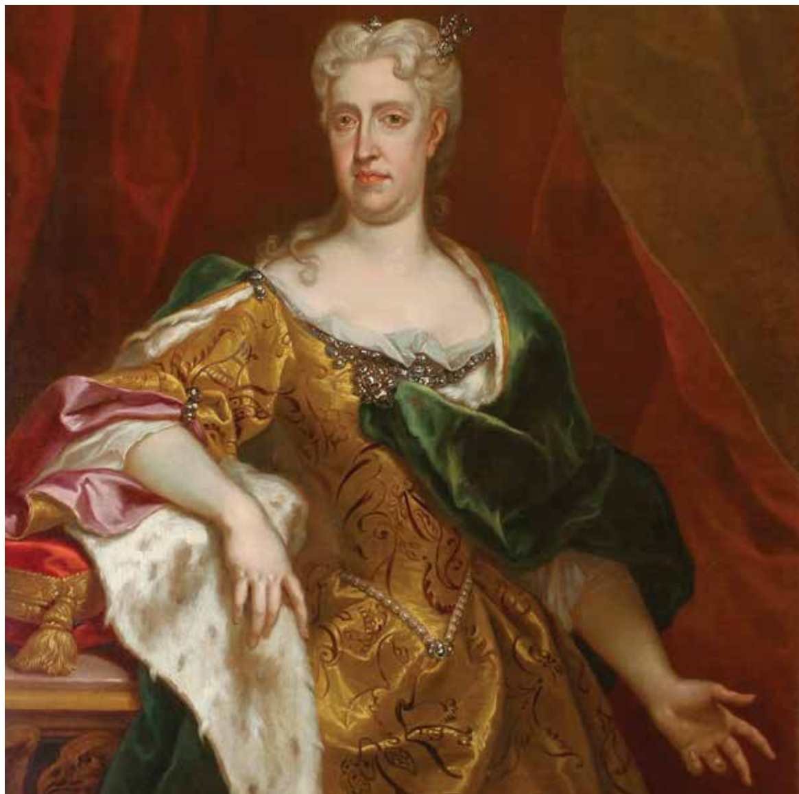
Jan van Orley (1665–1735), Statthalterin Maria Elisabeth (1680–1741), 1725, Öl auf Leinwand, 125 × 98 cm, Sammlung der Musées de la Ville de Bruxelles – Hôtel de Ville

Neapel und hat den Erzieher und engsten Berater Kaiser Karls VI. als Schwiegervater.