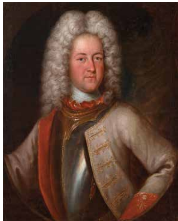
Anonymous, Adam Sigmund von Thüngen, 1720, Oil on Canvas, 82,2 x 66 cm, Collection of M3E / MNAHA

Sub umbra alarum. Luxemburg, Festung der Habsburger 1716-1741 vom 12. Oktober 2023 bis zum 14. April 2024 im Musée Dräi Eechelen